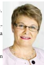
Näringslivsminister Maud Olofsson.

- Det trendbrott vi nu ser är mycket glädjande. Men för att nå ända fram under mandatperioden krävs fler konkreta förenklingsåtgärder inom viktiga områden för företagen. Dessutom måste departement och myndigheter ge ännu bättre återkoppling på de förslag som näringslivet lämnat, säger Maud Olofsson.